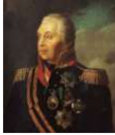
Б) А.В. Суворов