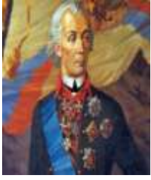
А) М.И. Кутузов

20. Посмотрите на портреты и выберите имя великого русского полководца XVIII века, который не проиграл ни одного сражения. -