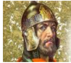
В) Александр Невский